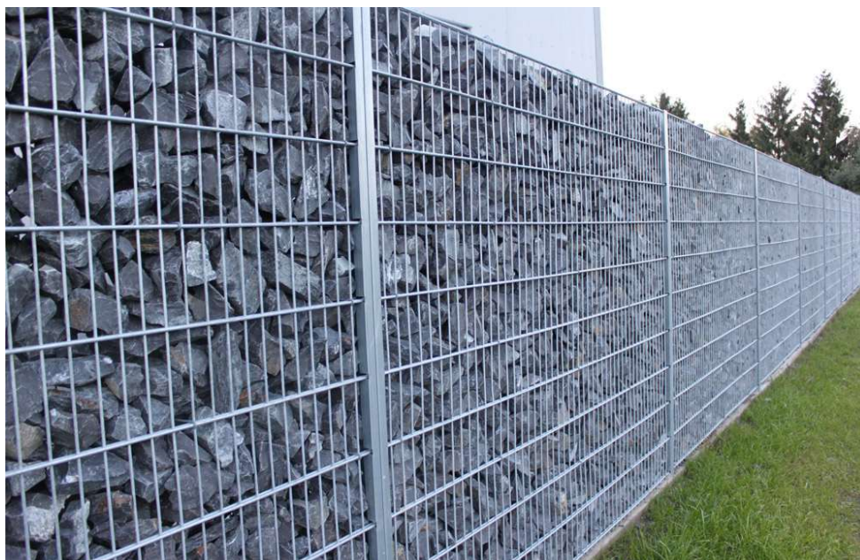
Clôture-gabions en panneaux double fil de 8/6/8, en mailles de 50/200 mm